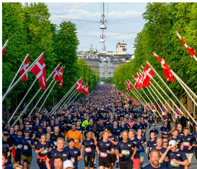
Menneskemængde på Frederiksberg