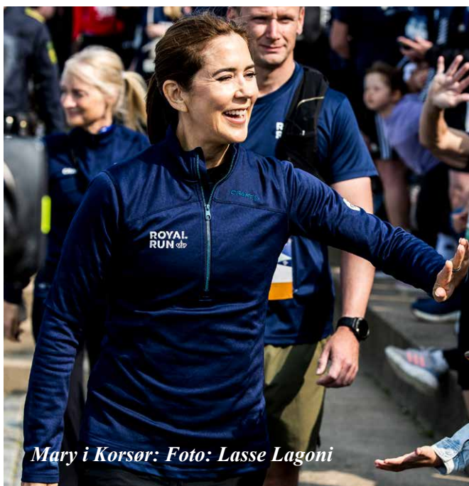
Mary i Korsør: Foto: Lasse Lagoni

Pinsedag 2026 er en mulighed for at deltage i folkefesten. Grib den – med eller uden startnummer. ■